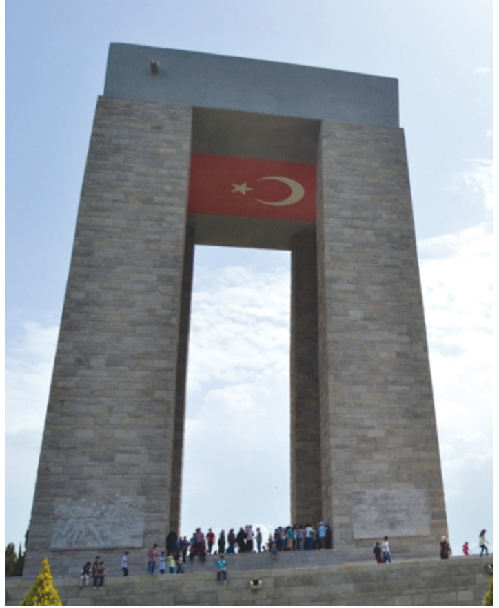
Çanakkale Şehitler Abidesi

mısralarını terennüm etmiş ve İstiklâl Marşımızı bu ulvi duygularla vücuda getirmiştir.