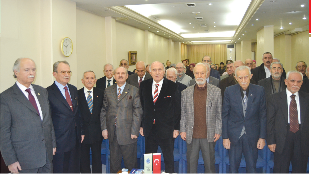
Program, saygı duruşu ve İstiklâl Marşı ile başladı.