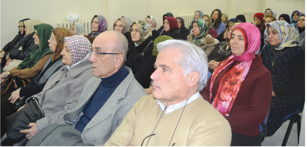
Programa katılanlardan bir grup.

Kastamonu Nasrullah Camii'nde "nl Sevr Antlařmasını" da konu alan tesirli hitabını yapmış ve milletin bu antlařmayı yırtması gerektiğini haykırmıştır. Akif'in bu vaaz ve konuşmaları küçük risaleler halinde binlerce nsha bastırılıp Anadolu insanına dađıtılmıştır.