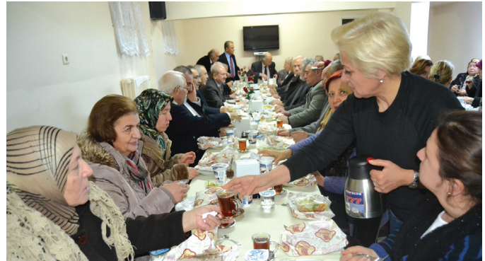
Program sonu ikramdan görüntüler.