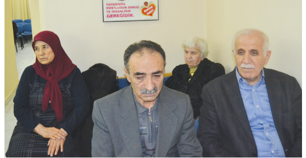
Programa katılanlardan bir grup.

Milli şairi 80. vefat yıldönümünde saygıyla anıyor, Allah'tan mekânının cennet olmasını niyaz ediyorum.