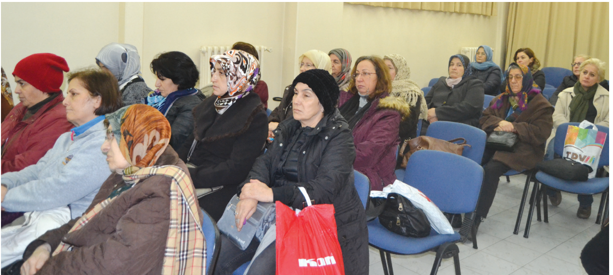
Programa katılanlardan başka bir grup.