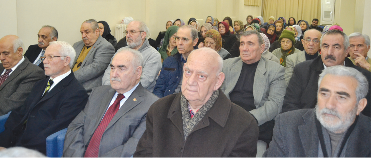
Programa katılanlardan bir grup.

Dolayısıyla Âkif'i anmak, O'nun için de, ananlar için de güzel bir vesîle olduğu gibi, O'nu anlamak ve anlatmak için de güzel bir vesîledir.