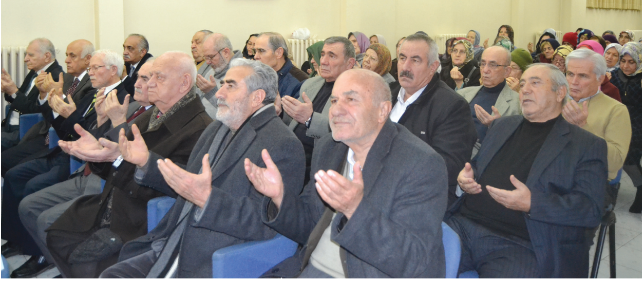
Hatim duasından bir görüntü.