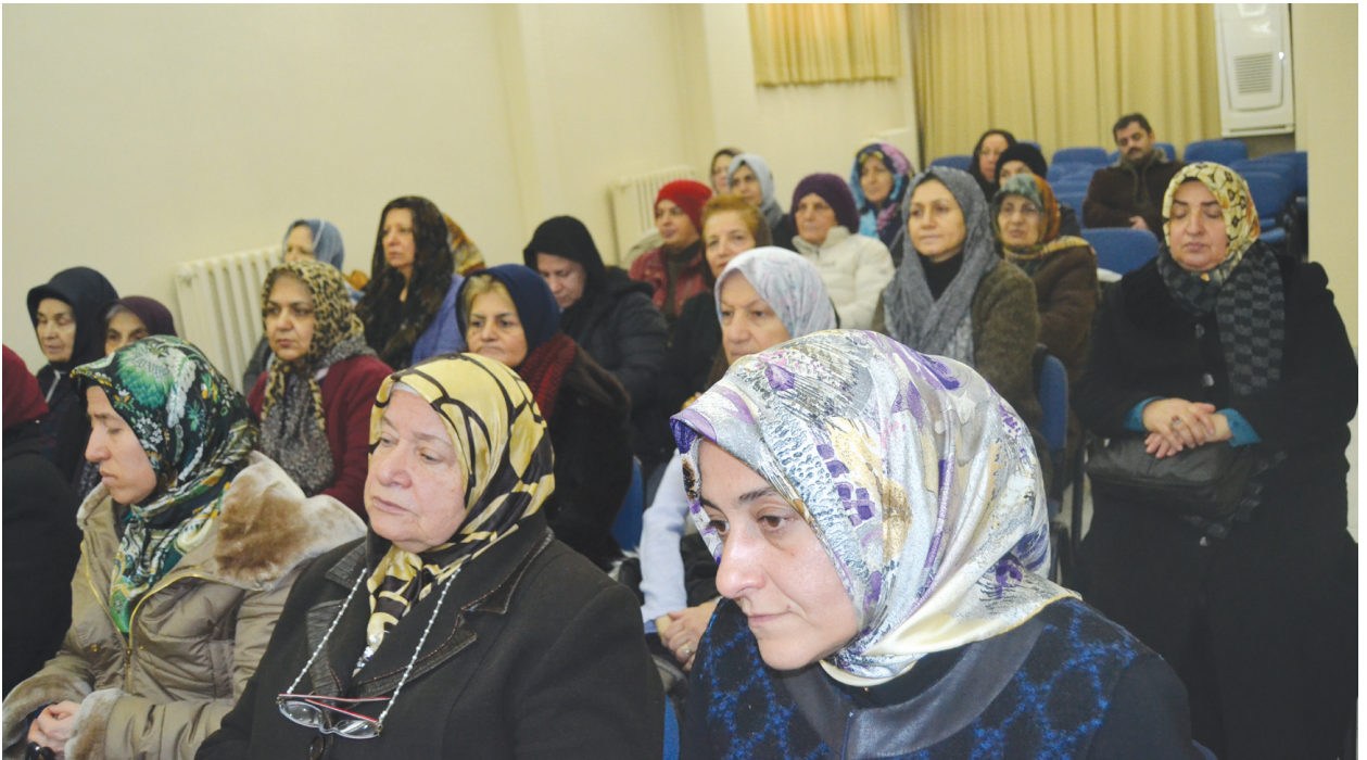
Programa katılanlardan bir grup.

Büyük şairin kendisini ve aziz şehitlerimizi rahmetle anıyor, yüce Mevlâ'dan cümlesine rahmet-i ilâhiyesini esirgememesini niyaz ediyor ve hepimizi saygıyla selamlıyorum.