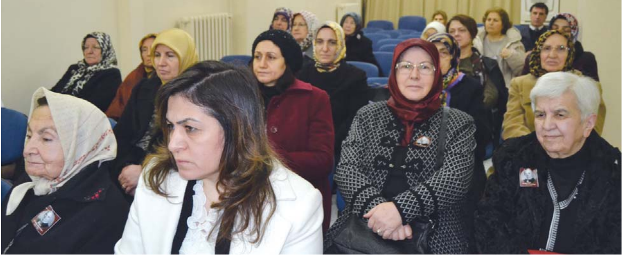
Panele katılanlardan bir grup.

ve sürekli bir okuma iştiağı içerisinde olduğunu dile getiriyor. Nitekim daha sonra Hukuk Mektebini de bitirmesi, bunun bir göstergesidir. Aynı şiirinde söylediği üzere Muallim Rif'at'ın araştırma ve incelemelerinin ağırlık noktasını, hatta tamamını Türk Kültürü ve Edebiyatına ait eserlerin tetkiki oluşturmaktadır. Bu hususun, onsekiz yaşına kadar doğup büyüdüğü Kilis'in bir bilim ve sanat şehri olması ile izah edilmesi yanlış olmayacaktır. Zira o tarihlerde Kilis, uleması ve özellikle Mantık alanındaki Hocalarıyla, dikkati çeken bir merkez durumundaydı. Yukarıda zikredilen noktaları şu başlıklar altında toplayabiliriz: