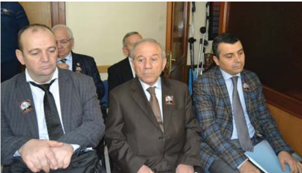
Panele katılanlardan diğer bir grup.

Bu inanç ve anlayışla, yıllardır ölüm yıldönümü dolayısıyla düzenlediğimiz toplantılarda okuduğumuz hatm-i şeriflerin sevabını ruhuna armağan ederek rahmet ve mağfiret niyazında bulunmanın yanında, hayatı, hizmetleri, eserleri ve düşünceleri hakkında yapılan açıklamaları yayınlamak, genç kuşaklara aktararak anlatmaya çalışmaktayız. Bu çalışmalar Vakfımızın yayın organı olan ve tetkikinize takdim edilen YOYAV Dergisi'nin 160, 198, 245 ve 282. sayılarında okuyucularımızın istifadesine sunulmuştur. Böylece unutulmamasına, örnek alınmasına, gelecek yıllarda hürmet ve muhabbetle anılmasına katkıda bulunulması hedeflenmiş ve benzeri bilgilerin günümüzde de yetiştirilmesine vesile olması gözetilmiştir.