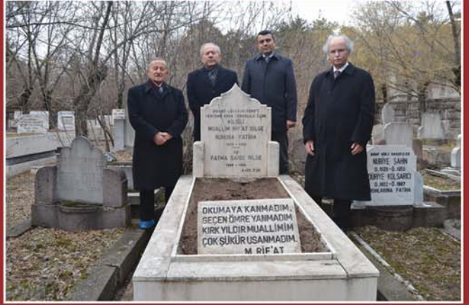
Merhum Kilisli Muallim Rif'at, mezarı başında Kur'an-ı Kerim tilâveti ve dualarla anıldı.