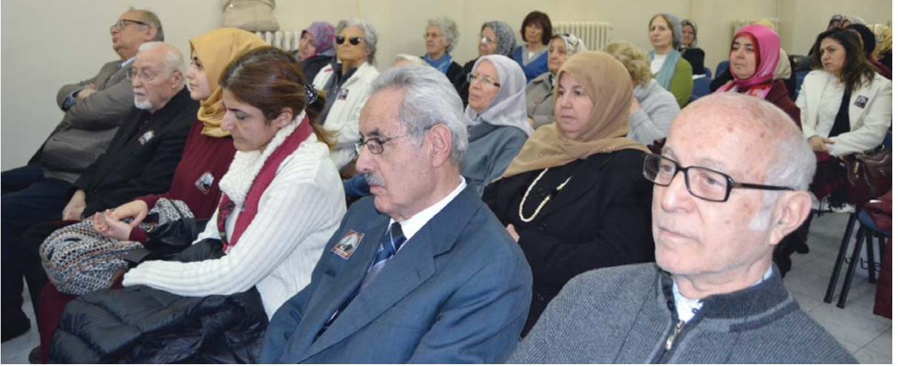
Panele katılanlardan bir grup.