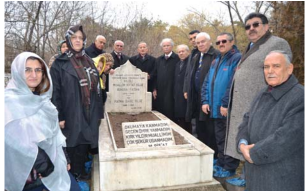
Kilisli Muallim Rif'at, mezarı başında anıldı.

Her fani gibi O'nun için yapılacak en güzel davranış budur. İnşallah okuduğumuz Fatiha ve ihlâslar, derecesinin yücelmesine ve Allah katındaki değerinin artmasına vesile olur.