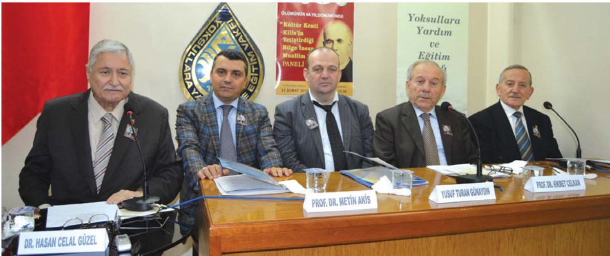
Oturum Başkanı ve panelistler kürsüde bir arada.

Yaşadığı yıllarda düşmanca davranan, çekemeyenleri olduğu gibi, çalışmalarını takdirle takip eden hayranları da olan ve ebediyete intikalinin üzerinden 64 yıl geçmesine rağmen, her geçen gün daha çok insan tarafından hürmet ve muhabbetle anılan merhum Muallim Rif'at'ı bir kere daha rahmet, mağfiret ve şükranla anıyor, ruhunun şâd, mekânının cennet ve makamının yüce olmasını diliyorum.