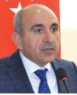
Av. Hasan KARA Kilis Belediye Başkanı