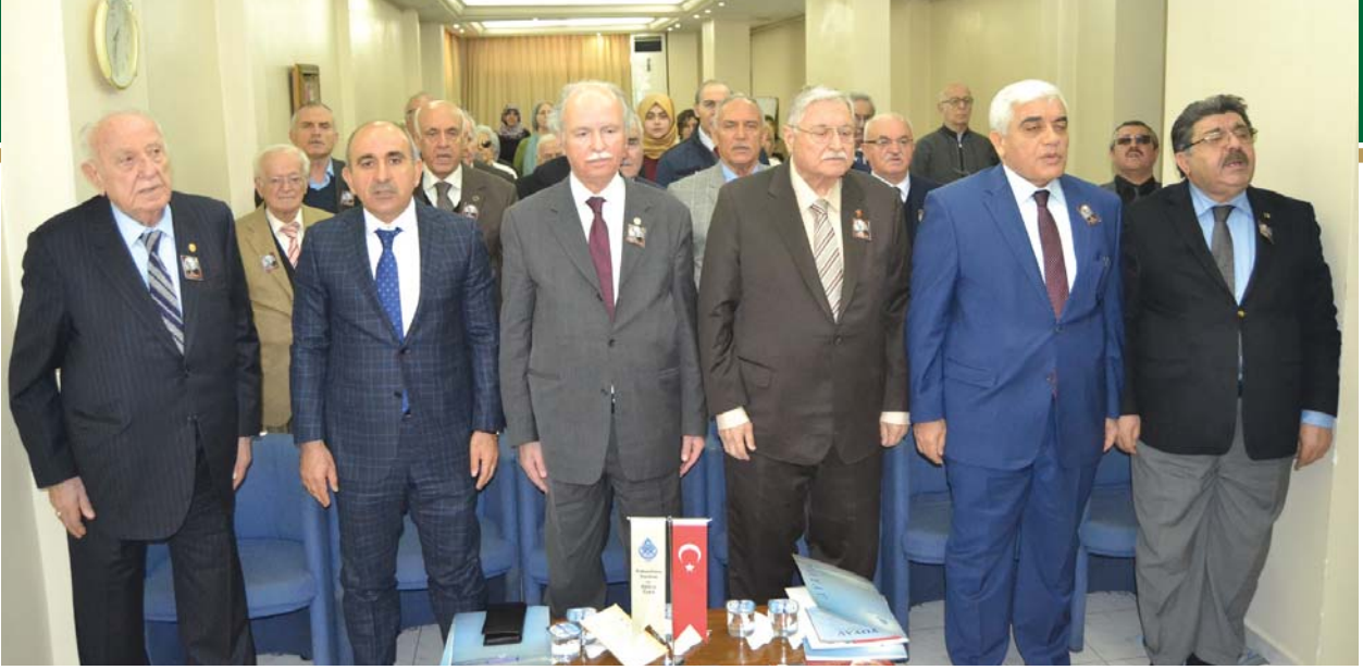
Panel, Saygı Duruşu ve İstiklâl Marşı ile başladı.

Bir gün bizler de O'nun gibi toprağın altına girecek, iman ehli vefakâr dostlarımızın bizleri ziyaret edip, ruhumuza rahmet dilemelerini, okuyacakları Fatihalar ve yapacakları hayırlı dualarla ruhumuzu şâd etmelerini bekleyeceğiz. İnşaallah dostlarımız da bizleri böyle anarlar. İnaniyoruz ki, anan anılır, anmayan yanılır. Anmak ve anılmak güzel, unutmak ve unutulmak da kötüdür.