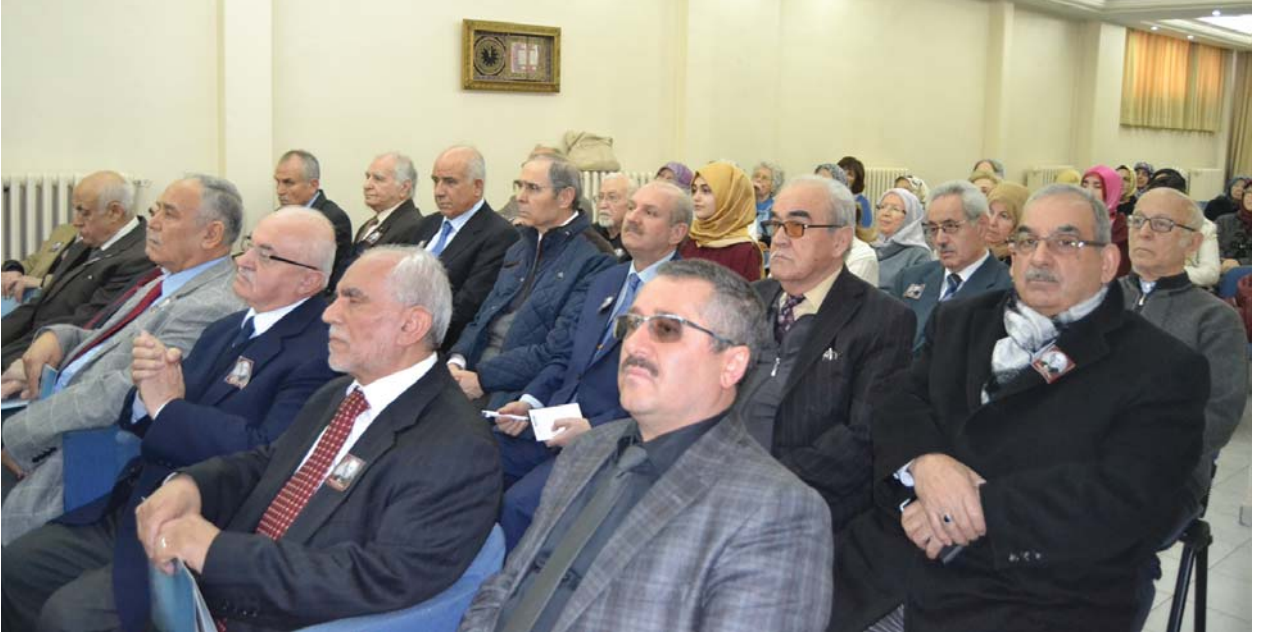
Panele katılanlardan bir grup.

deyimiyle çıt çıkmıyorsa, bunun altında yatan tek bir sebep var, o da aldığımız değerlerin bizde kalan bulaşığıdır. Biz inşallah bunu bulaşık olarak değil, bir değerler aktarımı olarak, bizden sonrakilere aktarmayı görev biliyoruz.