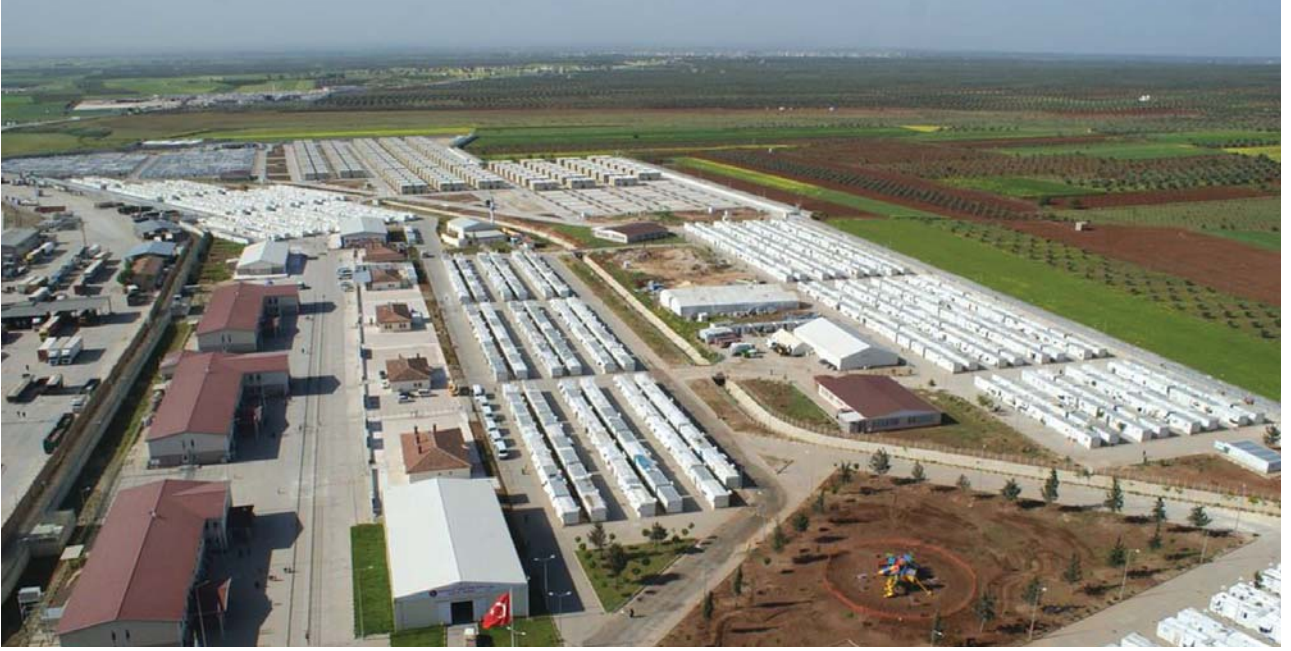
Kilis'te Suriyelilerin barındığı konteynir kentten bir görüntü.

Biz, dünya insanlık tarihinin kültürel mirasını yaşıyor ve yaşatıyoruz. Ben bundan dolayı Kilis halkının her ferdine şahsım adına şükranlarımı arz ediyorum. Bize öyle şerefli bir işi bahsettikleri ve dünya tarihine altın harflerle geçecek bir olayı meydana getirdikleri için.