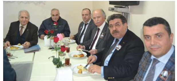
Panel sonrası ikramdan bir görüntü.