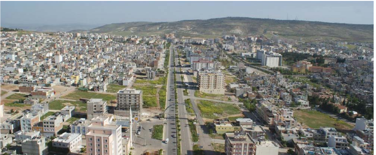
Kilis'ten bir görüntü.

Dünya insanlık tarihinin en büyük kültürel mirası ne diye soracak olsak, herkes kendi bulunduğu coğrafyanın tarihi ve tarihi güzelliklerini söyleyebilir ya da dünyanın 7 harikasını söyleyebilir. Ama biz Kilis olarak diyoruz ki, dünya insanlık tarihinin en büyük kültürel mirası, insanın vicdanındaki iyilik duygusudur. 21.yüzyıl insanı bunu kaybetti. Suriye olayı bunu turnusol kağıdı gibi ortaya çıkardı.