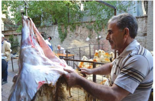
Kurbanlıklar İslâmî vecibelere uygun olarak kesildi, yüzüldü ve dağıtıldı.

Kurban ibâdetinin kesin dayanağı Hz. Pey-