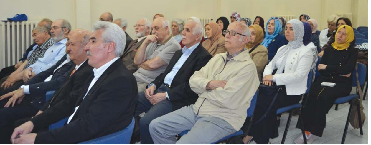
Panelse katılanlardan bir grup.

Simon Sebag Montefiore'nin "Kudüs, Bir Şehrin Biyografisi" adlı kitabında, Kudüs'te Kanûnî Sultan Süleyman'ın yaptırdığı imar ve ihya faaliyetleri şu şekilde anlatılmaktadır: