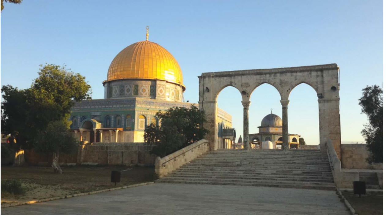
Mescid-i Aksa'dan Kubbet'üs-Sahra'ya çıkan merdiven ve sütunlardan bir görüntü.

17) veya Kudüs'ü de içine alan Filistin'i (Fahredden er-Râzî, XI,196-197) ifade ettiğini belirtmişlerdir'