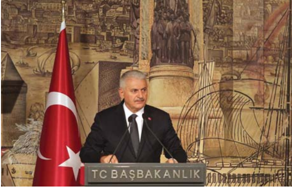
Binali Yıldırım, akşam yemeğinde konuklara hitap ederken.

mesi mümkün olmayan tasarrufları karşısında, bu mukaddes şehrin dini ve tarihi mirasına sahip çıkmak, geçmişimize ve kimliğimize sahip çıkmak anlamına geliyor. Kudüs'ün ve Harem-i Şerif'in İslam'a ait bir mekân olarak muhafazası, bütün Müslümanların görevidir.