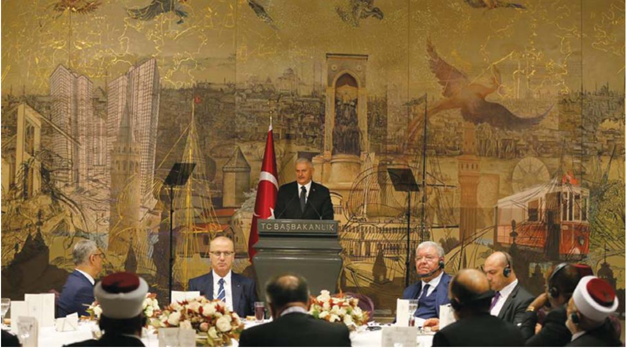
Binali Yıldırım, akşam yemeğinde konuklara hitap ederken.

yoruz. 14 asırdır İslam'ın olan Kudüs'ün, dünyada hiçbir devletin kabul etmediği bir işgal ile İslam'dan alınması, insanlığın ortak mirası olmaktan çıkarılması, asla kabul edilebilir değildir. Zihinlerden bu Kudüs sevgisi silinemez.