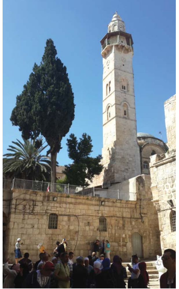
Kudüs, Hz. Ömer Mescidi

Kudüs fatihi Hz. Ömer ve Ebu Ubeyde ibnu'l-Cerrah'tır. İlk Müslüman fetihleri esnasında Hz. Ömer zamanında sıra Kudüs'e gelmişti. Başkumandan Ebû Ubeyde b. Cerrâh'tan aman dileyen ve Suriye şehirleriyle yaptıkları anlaşmalara benzer bir anlaşmanın kendileriyle de yapılmasını teklif eden Kudüs halkı, şehri bizzat halifeye teslim etmek istediklerini bildirdiler. Davet üzerine son derece mütevazı elbiseler içinde Kudüs'e giren Hz. Ömer, şehre İslâm'ın verdiği izzet ve şerefle girdiklerini, üzerindeki yamalı elbiselerin hiçbir değeri olmadığını hâl ve davranışlarıyla anlatıyordu. Şehri Patrik Sophronius'tan teslim aldı ve anlaşmayı imzaladı (17/638). Anlaşma esas olarak Kur'ân ve Sünnet'e dayalı olarak cizye ve haraç karşılığında