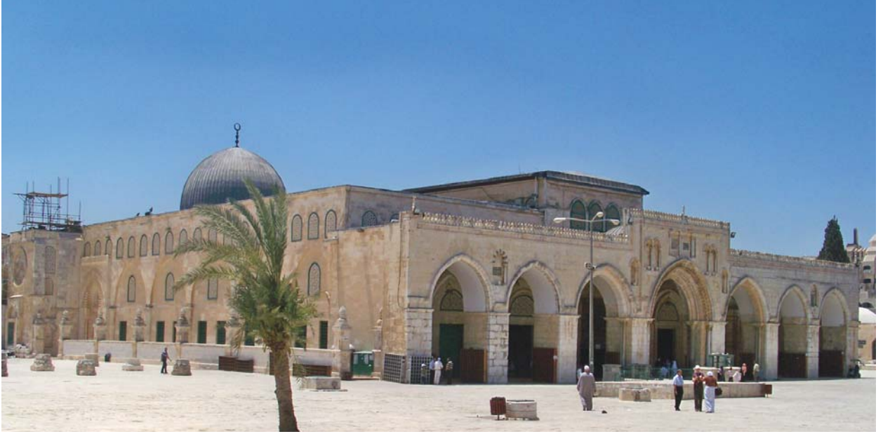
Mescid-i Aksa'dan bir görüntü.

Sultân'ın Mekke ve Medine'de yaptırmış olduğu, Mimar Sinan'ın tezkirelerinde adı geçen imâretler zincirinin bir halkası idi.