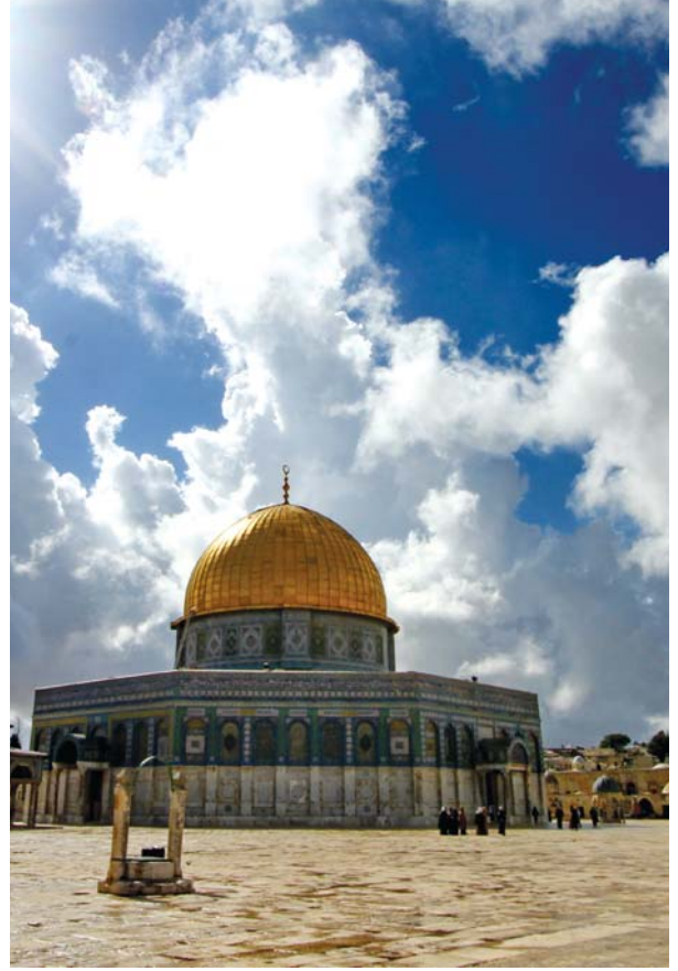
Kubbet'üs-Sahra'dan bir görüntü.