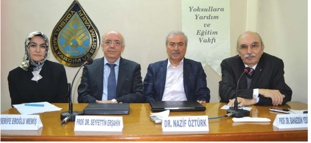
Panel yöneticisi ve panelistler bir arada.

İki kıblenin ilki ve iki haremın üçüncüsü olan Mescid-i Aksâ'yı bağrında barındıran Kudüs, değeri Kur'ân'da dile getirilen mübârek bir şehirdir. Her karış toprağında, nice peygamberlerle Hak dostu velîlerin hâtirasını ve izini taşıyan en eski ikinci ve en mukaddes üçüncü mescidin bulunduğu müstesnâ bir mekândır. Tabii, mekânın şerefi mekân iledir. Kudüs'ün kalbi niteliğindeki Mescid-i Aksâ ile Hz. Peygamber (s.a.v.)'in huzûr-u Hak'ka yüceltildiği yer üzerine yapılan Kubbet'üs-Sahra, şehrin değerine değer katan ve manevî meziyetini yansıtan mekânlerin önde gelenlerindedir.