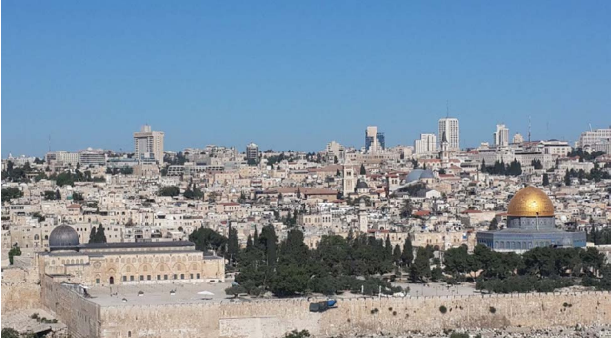
Mescid-i Aksa'nın bulunduğu bölgeden bir görüntü.

deFTERlerinden aktardığımız belgeler ve ileride vereceğimiz bilgilerden anlaşılacağı üzere, XIX. asrın ikinci yarısından itibaren Kudüs'te hemen her devlet; Almanya, Fransa, İngiltere, İtalya ve Rusya ayrı ayrı başvurularla kilise, havra, okul, hastahane, huzurevi, misafirhane, rahip ve rahibe meşrutaları yaptırma konusunda bir yarış içerisinde olmuşlardır. Bu dönemde Kudüs âdeta bu devletlerin nüfuz yarışına sahne olmuş bir şehir durumundadır. Daha sonra bu devletlere Amerika Birleşik Devletleri de katılmıştır. Her devlet mensup olduğu din ve tuttuğu mezhebin güçlenip gelişmesini istemektedir. İşin bir başka yönü de, belgelerde geçen isimlerden açık bir şekilde görüldüğü gibi, devletlerin siyasi gücünün kullanılmasıyla sağlanan bu gelişmelerin gerisinde çoğu zaman Yahudi parmağının olduğu görülmektedir 17 .