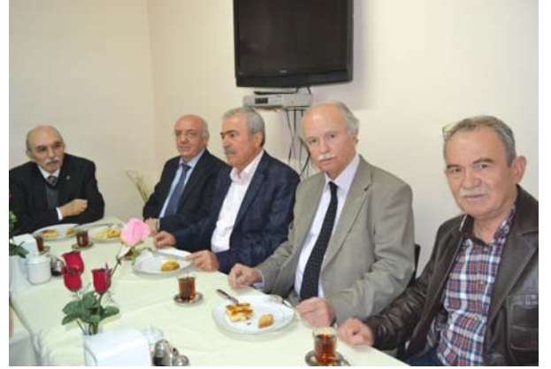
Panel sonu ikramdan görüntüler.

katılımları için takdir ve teşekkürlerimizi sunuyor, bugün için yazdığım "Kutsal Kent Kudüs" başlıklı (arka kapak içinde) altı dörtlükten oluşan şiirimle sizleri selamlamak istiyorum."