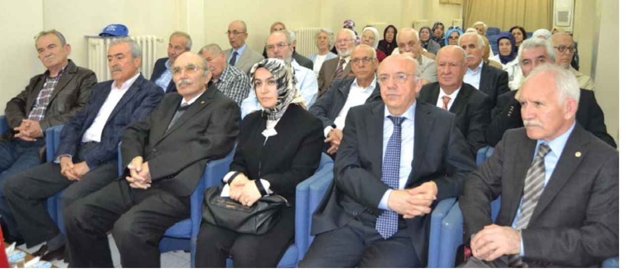
Panele katılanlardan bir grup.

tarihlerde muhtelif saldırılara maruz kaldığı da herkesin malumudur.