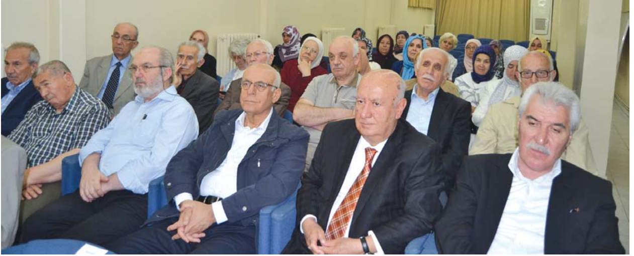
Panele katılanlardan bir grup.

bir bilimsel toplantıya katılmak üzere izin alma hakkın yoktur!".