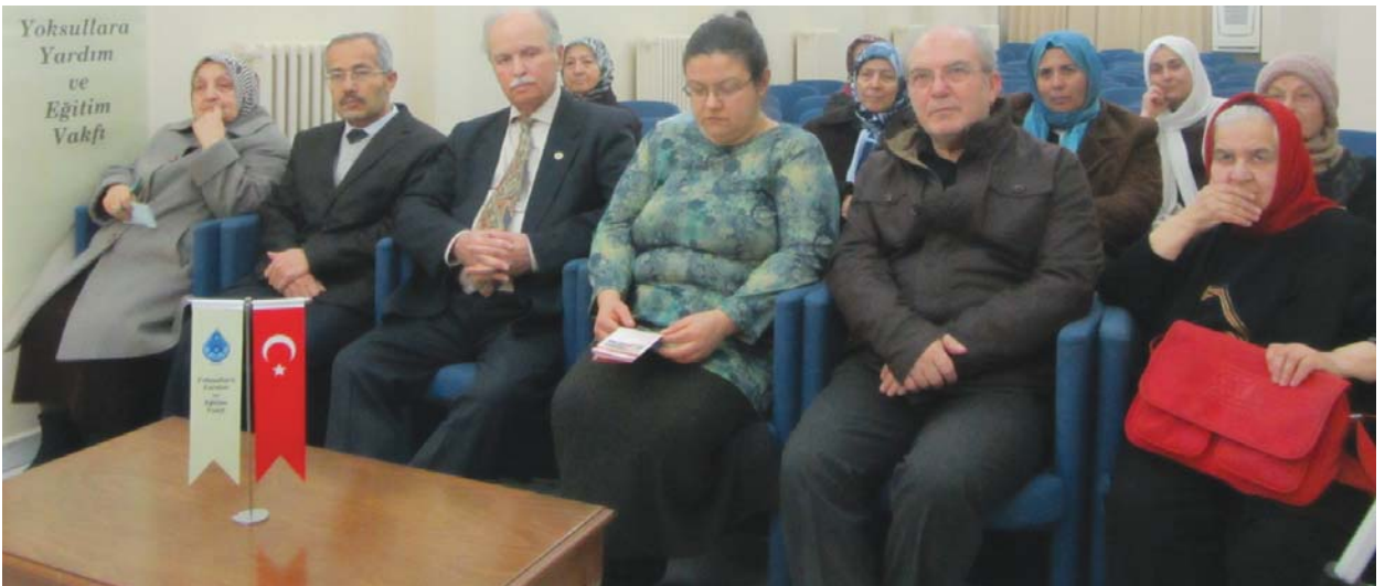
Konferansa katılanlardan bir görüntü.

YOYAV'ın değerli gönül dostları. Sizlere âcizâne önerim, günde en az "bir hadîs" öğrenmeye gayret edin ve onu, hayâtınızda uygulayın. Muâz bin Cebel'i hatırlayıp, Allâh'ın kitâbıyla ve Peygamberinin sünneti ile hayâtınızın mes'elelerine cevâp bulmaya çalışın ve "Lâ ilâhe illallâh"ın anlamını dâima hatırlayın. Hatırlayın ki, dünyânız da, âhiretiniz de, ma'mûr olsun.