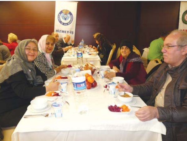
Toplantıya katılanlardan diğer bir grup.

Hepinize afiyet olsun diyor, teşekkür ediyorum.