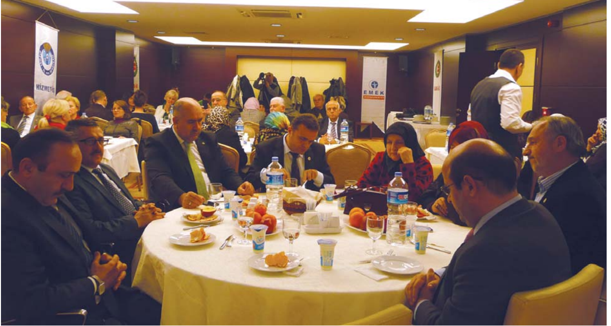
Yemekli toplantıdan bir görüntü.

gerekiyor. Yoksa insanlar tek başına, gelişmiş insanlar. Dolayısıyla güneye doğru gidince Afrika'da gerçekten böyle bir sorun var. Bunu ben çok önemsiyorum. Açlıktan da daha önemli bir durum olduğunu düşünüyorum.