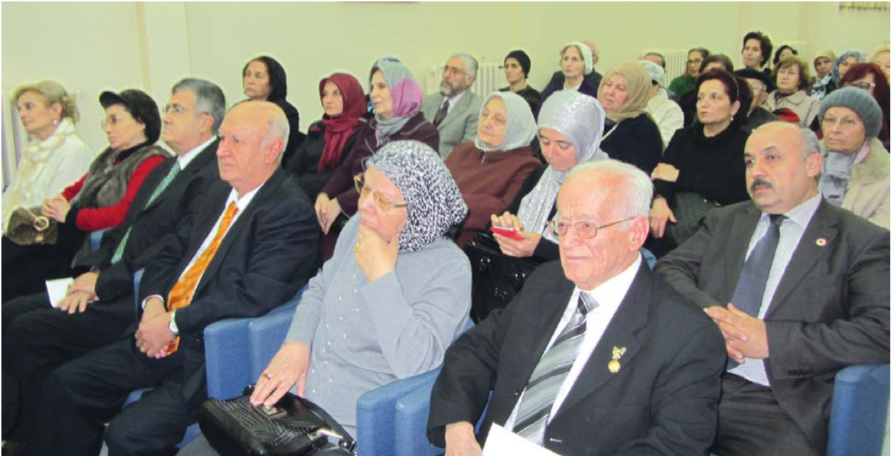
Toplantıya katılanlardan bir grup.

Bugün hayatta olan öğretmenimiz varsa onları