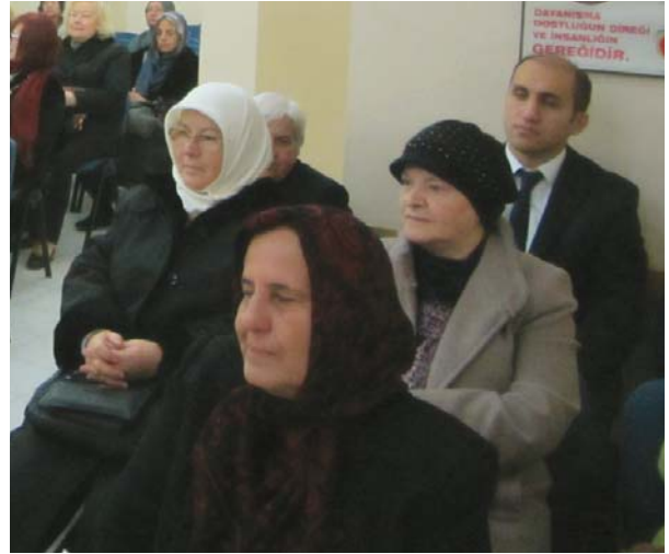
Toplantıya katılanlardan diğer bir grup.

Öğretmenler, öğretmenlikten önce öğrencilikten geçerler. Dolayısıyla öğrencilerin psikolojik problemleri ile insanî ihtiyaçlarını ve içtimai ilişkilerini herkesten daha iyi bilirler. Bunun için onlara karşı ana-babaları kadar yakın ve yapıcı olurlar