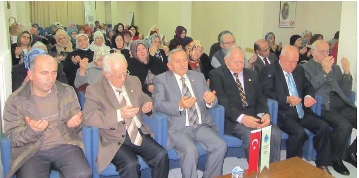
Hatim duasından bir görüntü.

Toplantı, davetlilere sunulan ikramın alınması ile noktalandı.