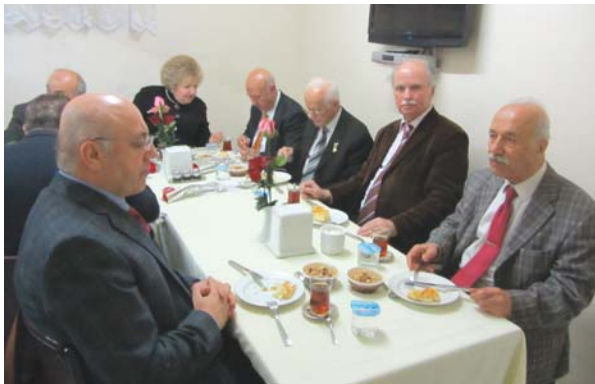
Toplantı sonu ikramdan bir görüntü.