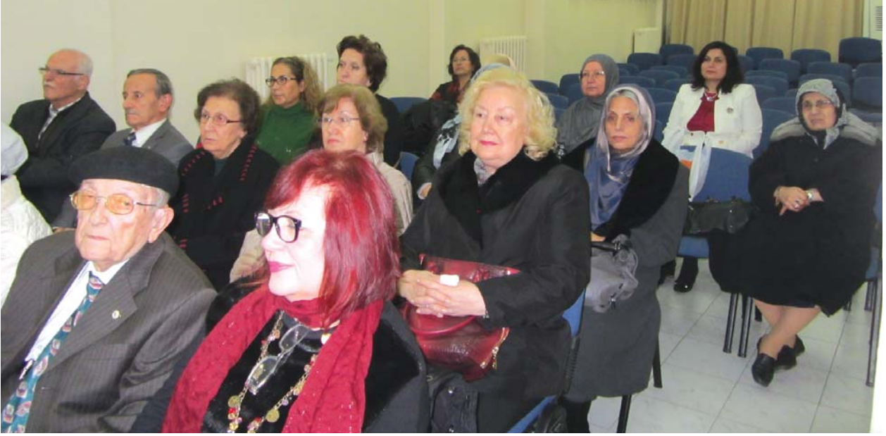
Toplantıya katılanlardan başka bir grup.

ziyaret etmeli, en azından bir telefon ederek hâl ve hatırlarını sormalıyız. Ebediyete intikal eden öğretmenlerimizi Fatihalar ve hayırlı dualarla anmalıyız.