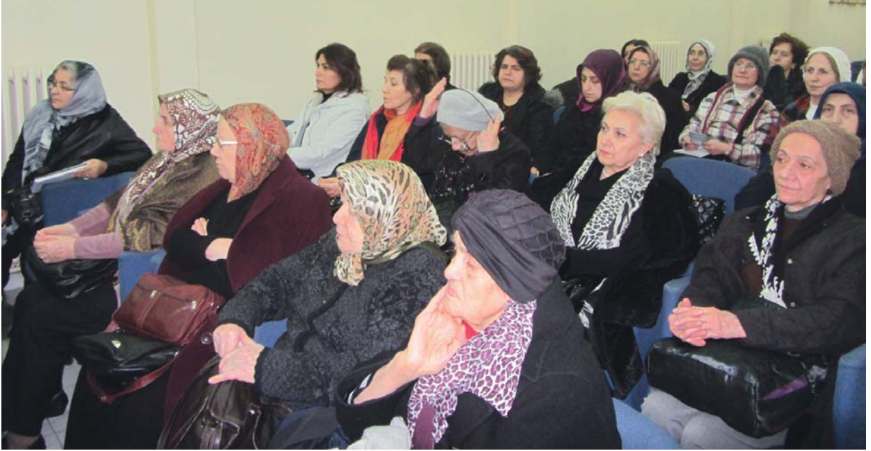
Sohbet toplantısına katılanlardan bir grup.

bazen sıkılıp başından çıkararak dinlenmeyi diler. Bilhassa yatarken başında bulundurmaz. Çünkü bu taçlar insanların yanında iken hoşlanılan, yalnız ve dinlenme anlarında iken çıkarılıp bir tarafa bırakılan taçlardır. Ben, yılın son “Sorun Söyleyelim” Sohbet Toplantısını yaptığımız bu gün sizlere, devamlı takılacak ve sahibine saadet-i sermediye sağlayacak manevî bir taçtan söz ederek onu takınmanızı tavsiye edeceğim. Bu taç “takva” tacıdır.