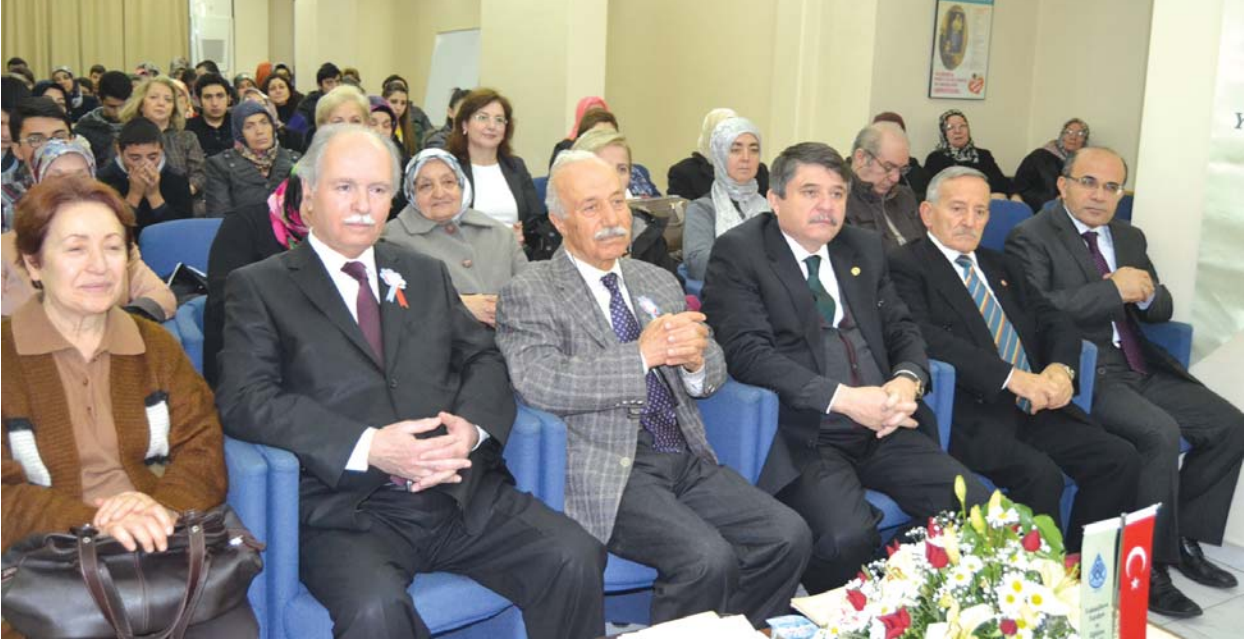
Seminere katılanlardan bir grup.