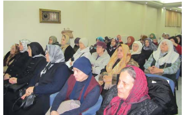
Toplantıya katılanlardan bir grup.

Hayatını Hakk'a ve halka hizmete adayan merhum Mehmet Âkif Ersoy, şiirlerinde Kur'an ve Hadîsin içerdiği islamî ilkeleri terennüm ederek insanları iman, irfan ve Kur'an'a davet etmiştir. Bu cümleden olarak: