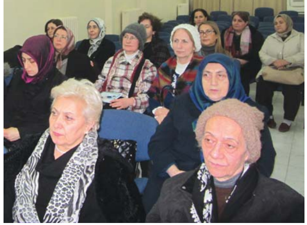
Sohbet toplantısına katılanlardan bir grup.

Muttakîlerin mazhar olacakları mutluluk vesî- lelerinin başında Yaradan'a yakınlık, muhabbet-i Mevlâ ve mağfîret-i Mennân ile nimet, nusret ve dühûl-ü cennet gelir Dilerseniz bu hususların be-