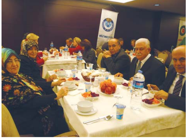
Toplantıya katılanlardan başka bir grup.

YOYAV başarılı ve uzman bir yardım kuruluşudur. Bizim Konfederasyon olarak ancak bir moral desteğimiz olabilir. Bizim yardımlarımız YOYAV'inki kadar düzenli olmayabilir.