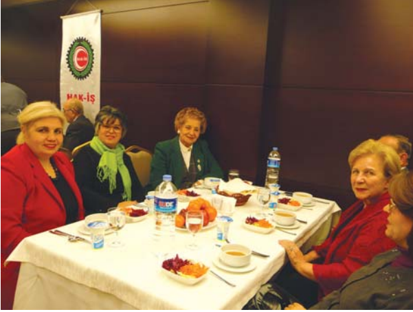
Toplantıya katılanlardan bir grup.