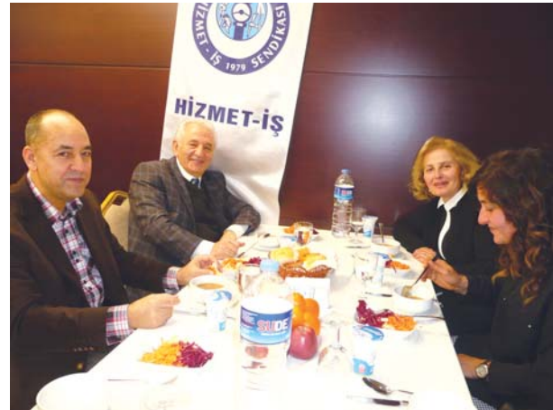
Toplantıya katılanlardan başka bir grup.