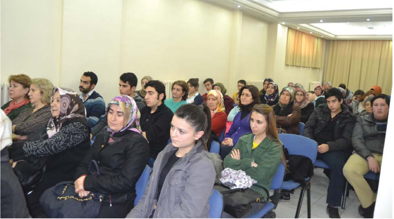
Seminere katılanlardan başka bir grup.

buyurulmaktadır. Sünnetten delilide yukarıda zikrettiğimiz sadaka-ı câriye hadisi şeriftir