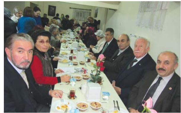
Toplantı sonu ikramdan başka bir görüntü.