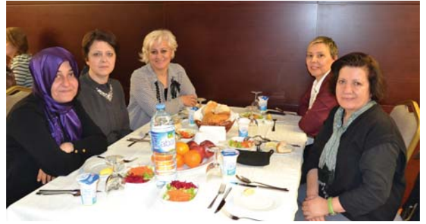
Toplantıya katılanlardan gruplar.