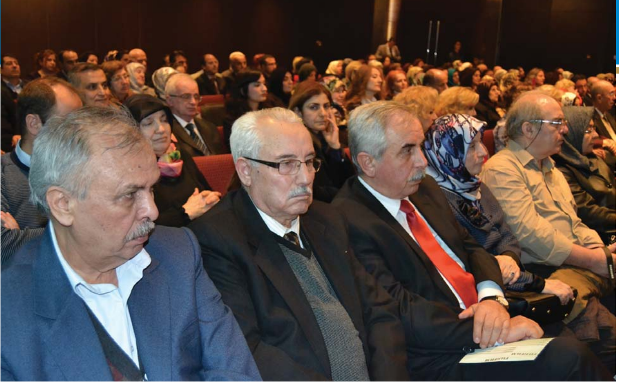
Törene katılanlardan başka bir grup.

İyilik, insanî bir ahlak, sorumluluk ve yükümlülüğü gerektirir.