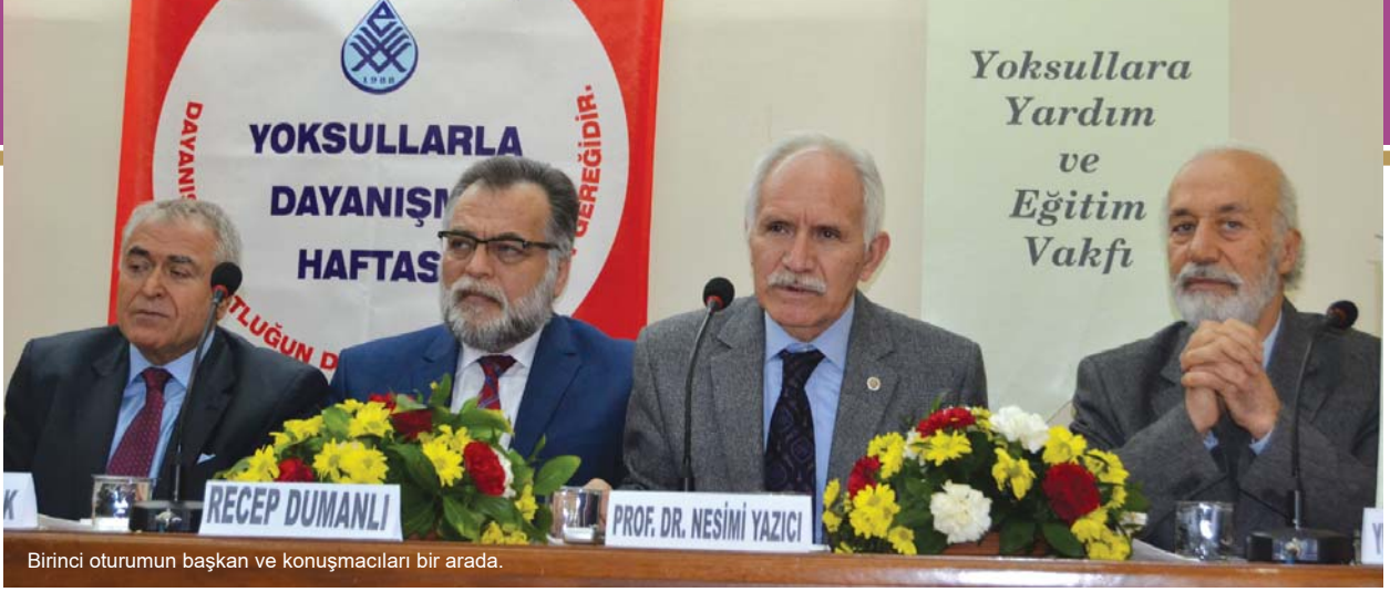
Birinci oturumun başkan ve konuşmacıları bir arada.