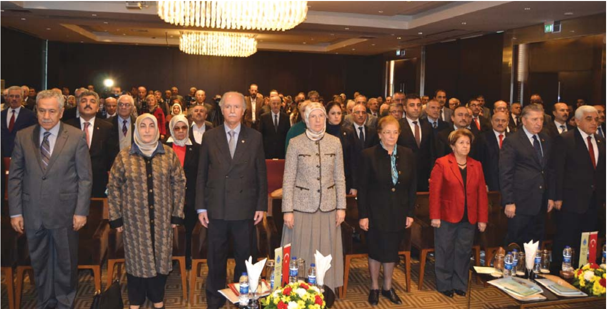
Saygı Duruşu ve İstiklâl Marşı'ndan başka bir görüntü.