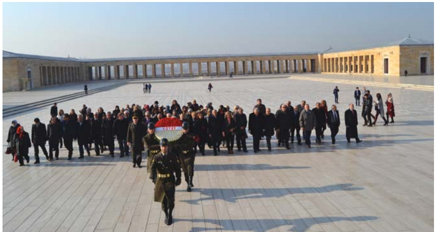
Anıtkabir ziyareti, zafer alanında yapılan törenle başladı.

Y irmi yedi yıldır yurt ve yurttaşlarımızın yücelmesi yolunda ileri adımlar atan Yoksullara Yardım ve Eğitim Vakfı’nın kuruluş yıldönümü ve 23. Yoksullarla Dayanışma Haftası’nın başlaması münasebetiyle Anıtkabir’i ziyaret edip, “İnsanları mesut edecek yeğâne vasıta, onları birbirlerine yaklaştırarak, onlara birbirlerini sevdirek, karşılıklı maddî ve manevî ihtiyaçlarını temine yarayan hareket ve enerjidir” diyen Atatürk’ün manevî huzu-