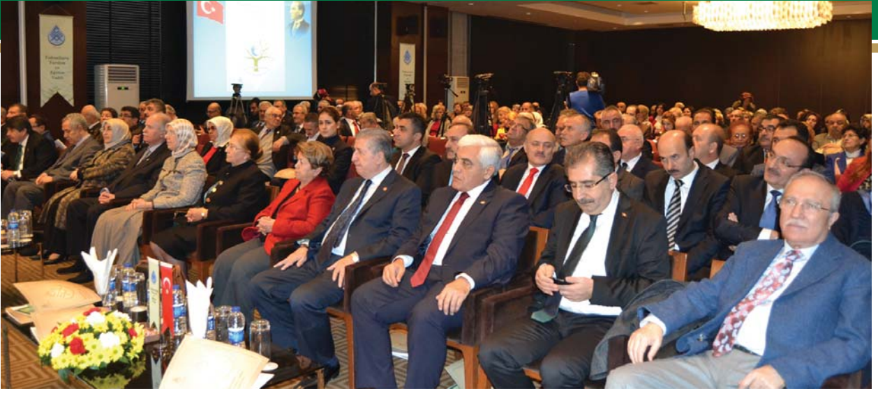
Haftanın açılış töreninden bir görüntü.