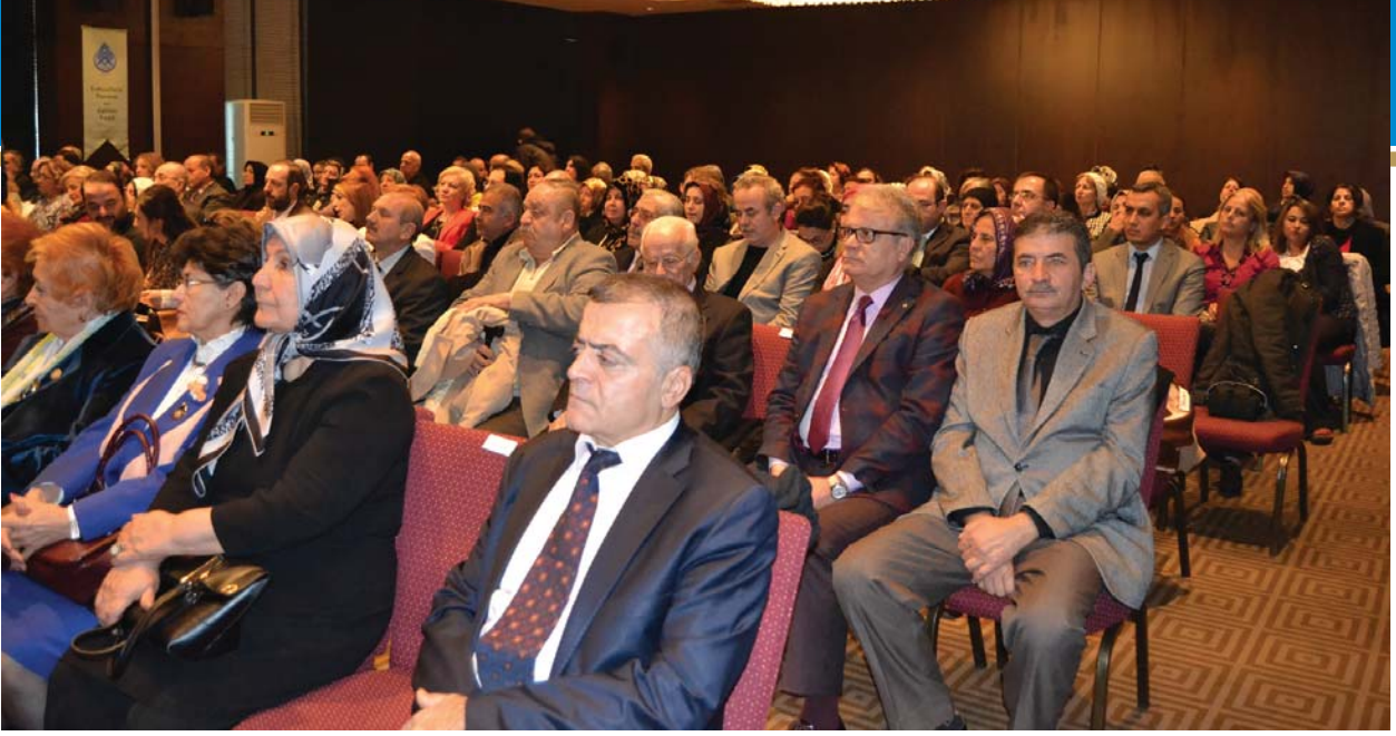
Törene katılanlardan bir grup.

toplam varlığına sahiptir. Bu rakam dünya nüfusunun yarısına tekabül etmektedir.