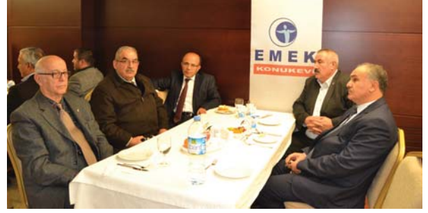
Toplantıya katılanlardan bir grup.

ye, çalışıp üretme ve sahip olduğumuz imkânları ona muhtaç olanlarla paylaşma cihetine gitmekteyiz.