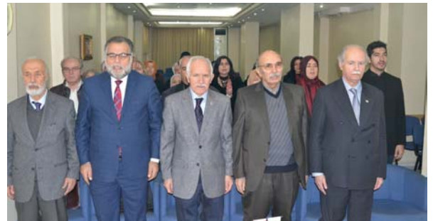
Seminer, saygı duruşu ve İstiklâl Marşı ile başladı.

İyiliğin önde gelen türlerinden biri de “karz-ı hasen”dir. Çoğunuzun anlamadığını sandığım, ama herkesin duymasını ve icabına uymasının zaruretine