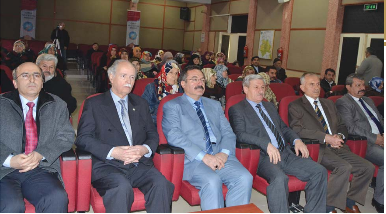
Konferansa katılanlardan bir grup.