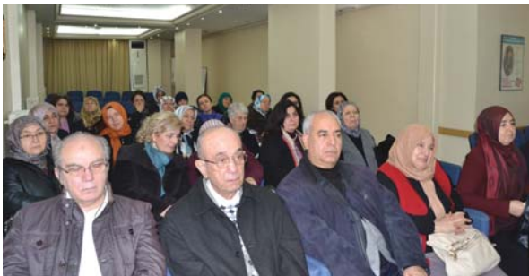
Seminere katılanlardan bir grup.

Öyleyse böylesi bir güzelliği bizlere sağlayacak