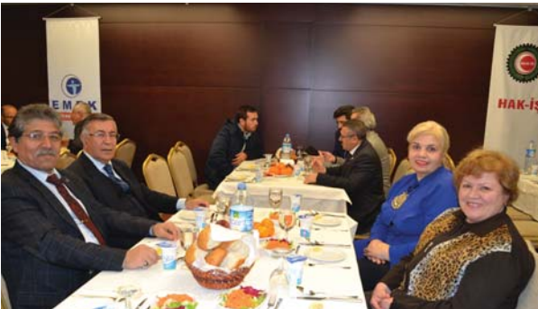
Toplantıya katılanlardan bir grup.

Yarın Allah divanına./Varam Allah deyu deyu." dörtlüğünü devamlı göz önünde bulundurarak her şeyi zamanında yapmaya, ibadet ve işlerimizi ertelememe-