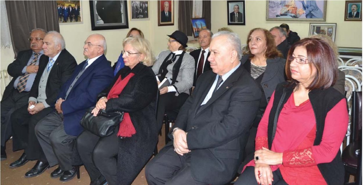
Panele katılanlardan bir görüntü.

Yanlışların düzeltilmesinde, eksikliklerin giderilmesinde ve haksızlıklara karşı çıkılmasında etkili bir güç olduğuna inandığım medyamızın, yoksullukla mücadelede yanımızda olacağı inancıyla sözlerimi noktalarken, çok önemsedğim bu paneli tertipleleyen Efece Haber İnternet Gazetesinin yetkilileri ile çalışanlarına takdir ve teşekkürlerimi yineliyor, panelde bildiri sunacak konuşmacıların bizleri aydınlatacak açıklamalarda bulunacakları ümidiyle kıymetli katkılarında, siz saygıdeğer konuklarımızın da değerli katılımlarınızdan dolayı hepimize şükranlarımı sunuyor, yüce heyetinizi hürmet ve muhabbetle selamlıyorum.