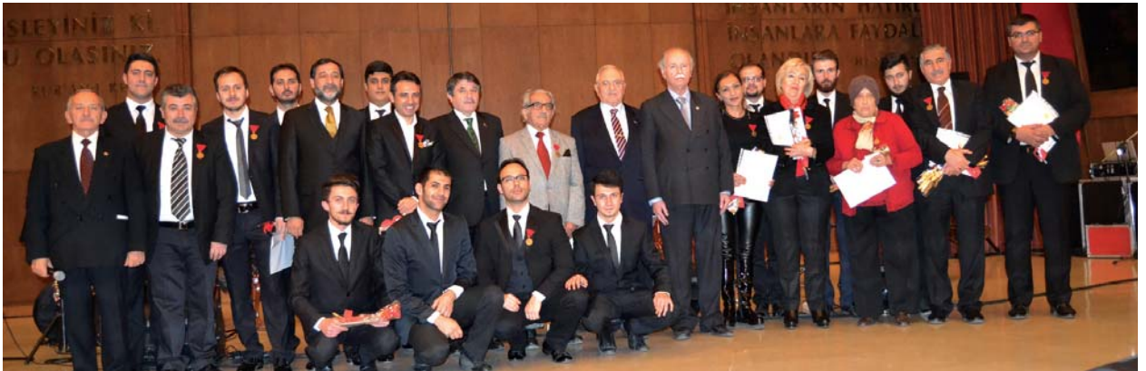
Sanatçılarla bazı konuklar, konser sonrası bir arada.