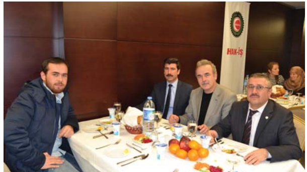
Toplantıya katılanlardan bir grup.