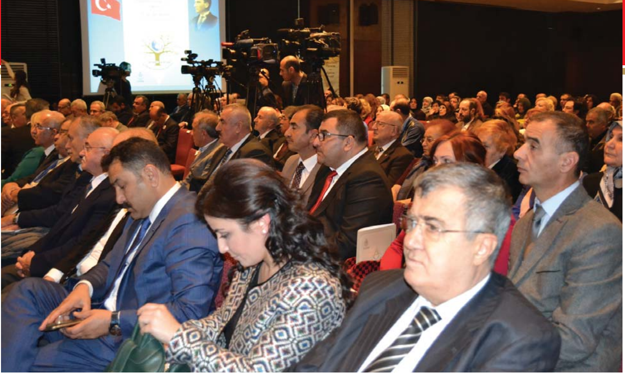
Törene katılanlardan başka bir grup.

diyorlar. Yani çok büyük şirketler kazançlarının bir kısmını kurdukları vakıflara aktararak, oradan sosyal ve toplumsal amaçlı bir hizmeti başlatıyorlar. Bu da desteklenmelidir. Çünkü büyük servetleri, büyük kazançları var. Onların bir kısmını AIDS'le mücadele gibi, sanatla ilişki kurmak gibi alanlara yönltebiliyorlar. Ama bizim bin yıllık inancımızın, geleneklerimizin içinde var olan vakıf medeniyetinde biz sadece insanları değil, hayvanat için de, mahlûkat için de en büyük vakıfları kurmuş bir neslin emanetçileriyiz.