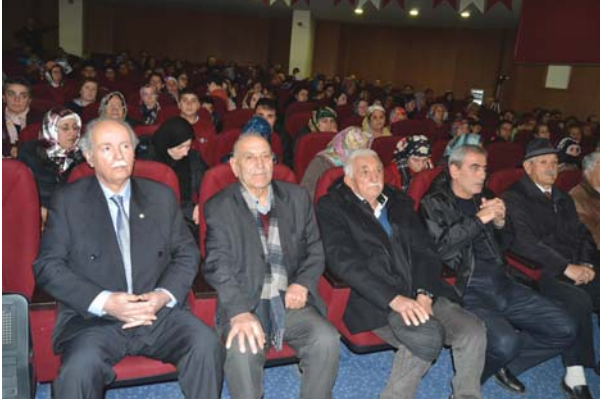
Konferansa katılanlardan bir grup.