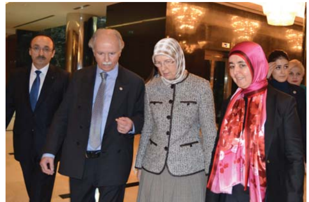
Aile ve Sosyal Politikalar Bakanı Sema Ramazanoğlu törene teşriflerinde.