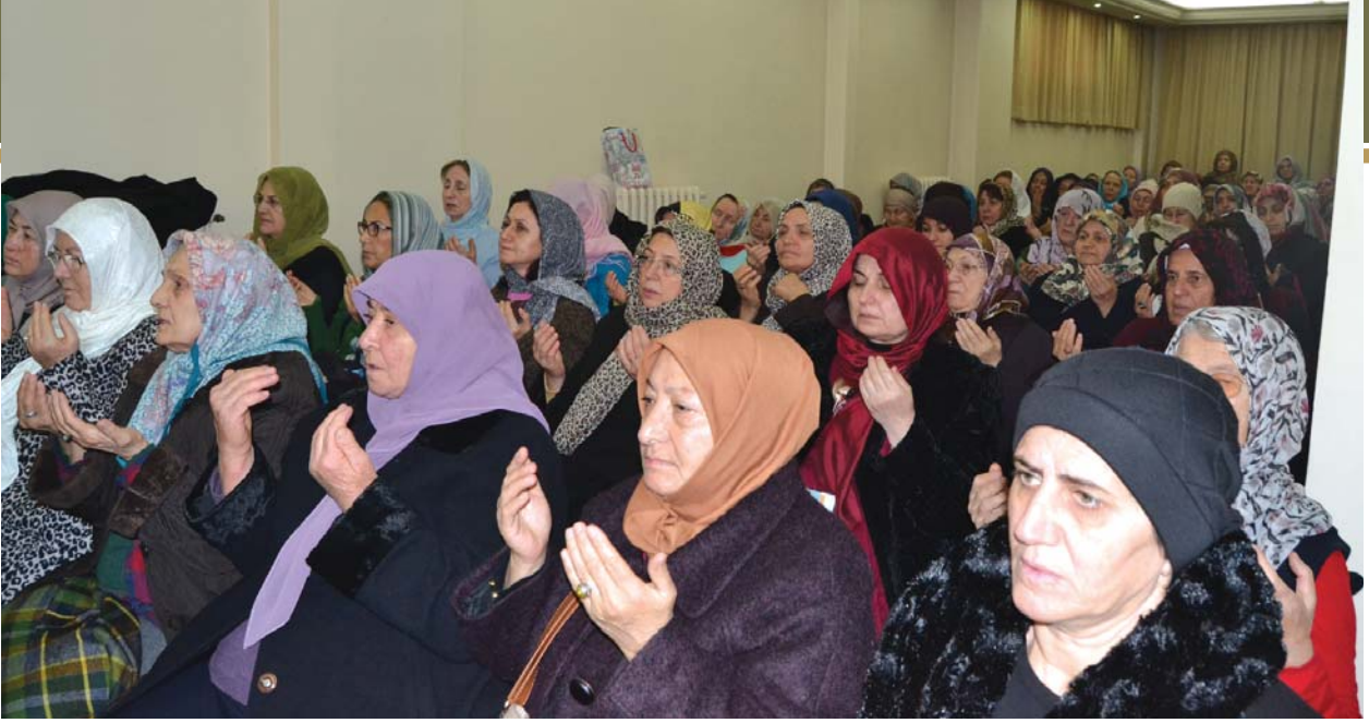
Duaya katılanlardan başka bir grup.

berdar eyle yâ Rabbî. Bizi ömür boyu O'nun nurlu yolundan ayırma. İzinde gitmeyi, yolunda yürüme-yi, adım adım O'nu takip etmeyi, sünnet-i seniyye-sine sahip çıkmayı, yaşadığı gibi yaşamayı, ahlâk-ı hamîdesi ile ahlaklanmayı, huzuruna varıp kemâl-i edeple ziyaret etmeyi, cennette O'na komşu olmayı ve şefaatine ermeyi bizlere nasip eyle yâ Rabbî.