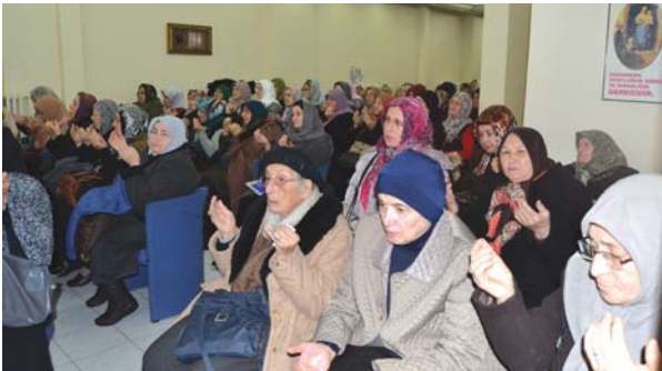
Duaya katılanlardan bir grup.