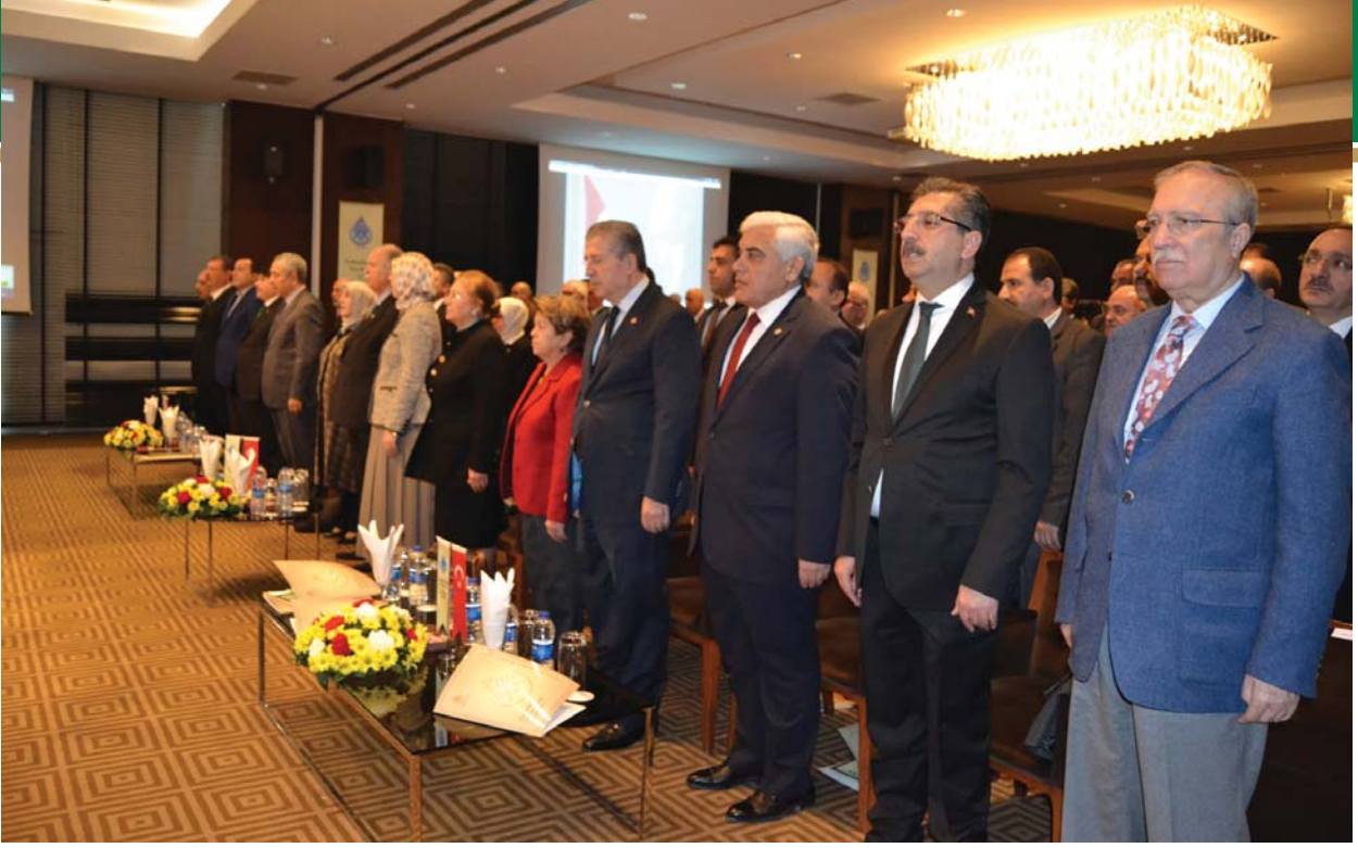
Saygı Duruşu ve İstiklâl Marşı'ndan bir görüntü.