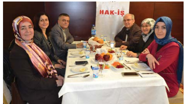
Toplantıya katılanlardan bir grup.