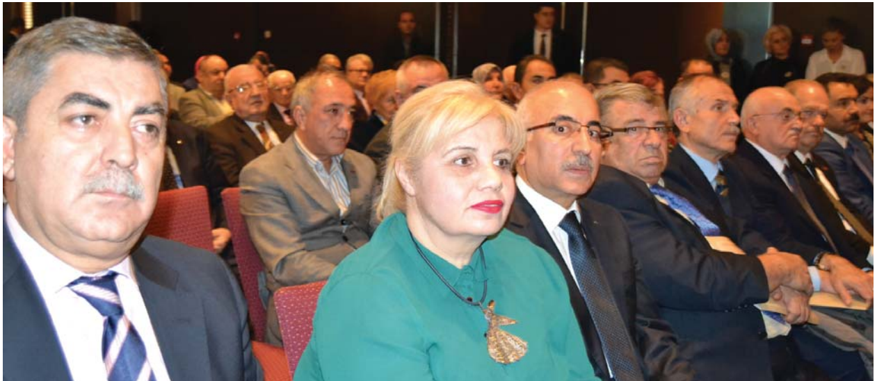
Törene katılanlardan bir grup.

Devleti dirayetli, yönetimi yürekli, insanı üretken, toprağı verimli, ürünü bereketli ve halkı hayırsever olan ülkemizin yoksulluğa yenik düşmeyeceğine inandık. Bu inanç ve anlayışla yola devam ettik. Bugün bir kere daha huzurunuzda geldik. İlgi, destek, katkı ve katılım gördük. Davamıza destek veren devlet büyüklerimizle dost ve kardeş kuruluşlarımızın başkan ve diğer yetkililerine huzurunuzda şükranlarımızı sunuyor, Mevlâ-i Müte'âl Hazretlerinden onları ve sizleri ebedî hayatta cenneti, cemali ve rızası ile ödüllendirmesini niyaz ediyorum. Gününüzün dününüzden güzel, yarınınızın bugününüzden daha güzel, son anınızın en güzel olmasını temenni ediyorum.