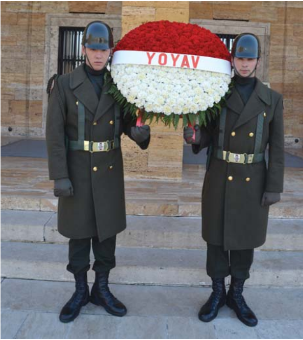
YOYAV çelengi kahraman Mehmetçiklerin omuzlarında.

runda bulunarak haftayı başlatan YOYAV’lılar, 12 Aralık 2015 Cumartesi günü sabahın erken saatlerinde toplu halde Anıtkabir’e hareket ettiler. Soğuk bir kış günü olmasına rağmen, diğer bazı kardeş kuruluşlardan gelen vefakâr dostları ile birlikte tören alanında buluşarak anlamlı bir dayanışma örneği sergilediler. 53’ü YOYAV’lılardan, 15’i Çıracak Eğitim ve Öğretim Vakfı’ndan, 10’u Çubuk Dernekler Federasyonundan, 9’u Tüm Bağ-kur Emeklileri Dul ve Yetimleri Sosyal Dayanışma Derneği’nden, 7’si TESVAK’tan, 7’si Yurt-AyDerneği’nden, 5’i Kilis Yardımlaşma Derneği’nden, 5’i de Türkiye Gücsüzler ve Kimsesizlere Yardım Vakfı’ndan olmak üzere toplam olarak 8 kuruluştan 110 kişiye ulaşan ziyaret heyetini oluşturdular. Böylece 23. Yoksullarla Dayanışma Haftasında planlanan 70 etkinliğin ilki olan Anıtkabir ziyaretinde Ata’nın manevî huzurunda bulunmanın bahtiyarlığına erdiler.