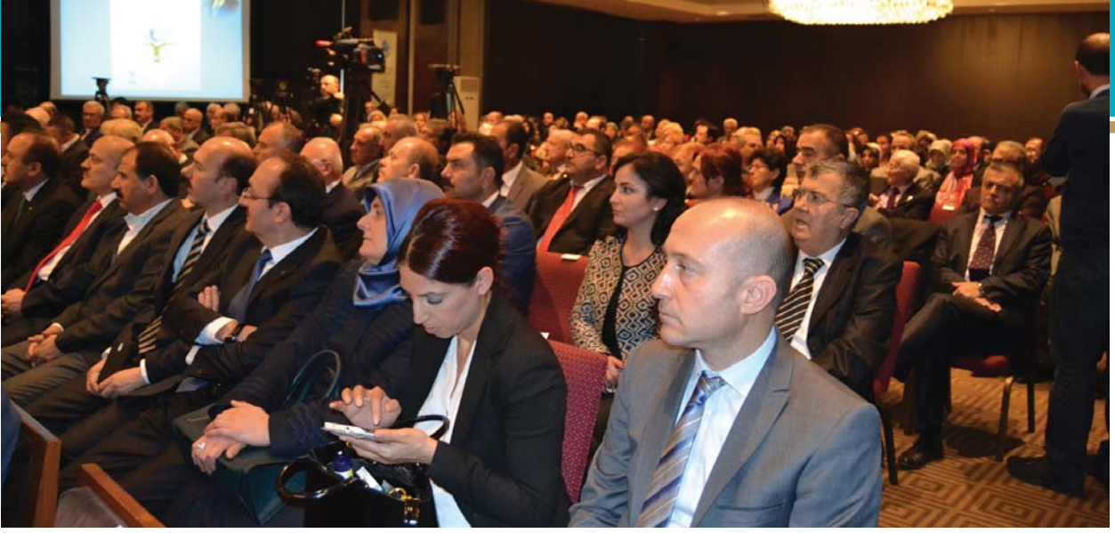
Törene katılanlardan bir grup.

ülkenin gelişmişlik düzeyine, insanî ihtiyaçlarının çeşitliliğine göre farklılık gösterir.