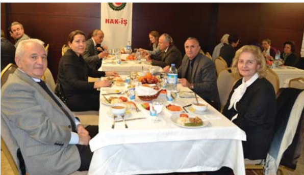
Toplantıya katılanlardan bir grup.