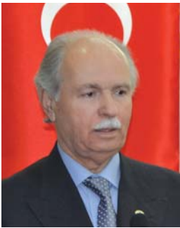
Dr. İbrahim Ateş.

Seminerin açış konuşması ile oturum başkanlarının konuşmalarının yanında 1. ve 2. Oturumda birbirinden güzel altı bildiri sunuldu. Seminerin açış konuşmasını yapan YOYAV Genel Başkanı Dr. İbrahim Ateş, amaç ve içeriğini özetleyen şu cümlelere yer verdi: