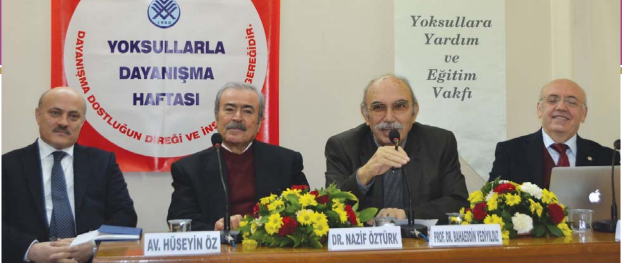
İkinci oturumun başkan ve konuşmacıları bir arada.

inandığım bu deyim, günümüz gençlerinin duymadığı önemli bir deyimdir. Yüce Rabbimizin kutsal kitabımız Kur'ân-ı Kerim'in 6 ayetinde dikkatimize getirip yaşatılmasını istediği önemli bir kalkındırma şeklini ifade eden bir deyimdir. Onun için bu yıl düzenlediğimiz Yoksullarla Dayanışma Haftası'nda planladığımız seminerde bu konuyu gündeme getirmek istedik.