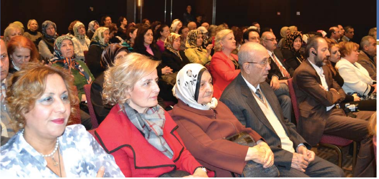
Törene katılanlardan başka bir grup.

Suriyelilerin sayısı 2 milyonu aştı. Barınma merkezlerinde, sığınmacıların sadece barınma ve gıda değil, sağlık, eğitim, ibadet, psiko-sosyal destek gibi birçok ihtiyaçları da karşılanıyor.