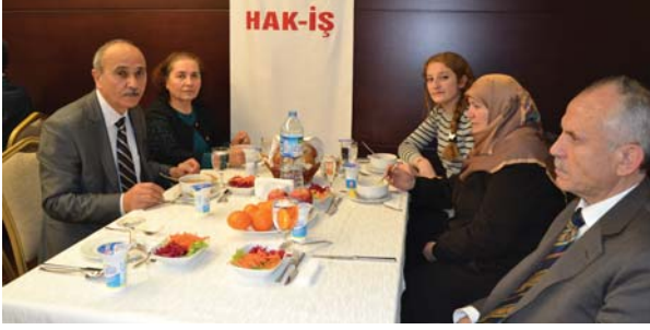
Toplantıya katılanlardan bir grup.