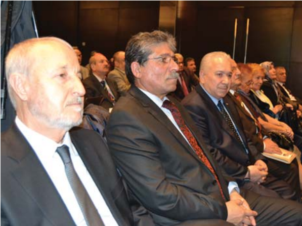
Törene katılanlardan bir grup.

Amerika'da başlayan, Avrupa'da etkisini gösteren yeni bir vakıf anlayışı var. Buna da filan profil