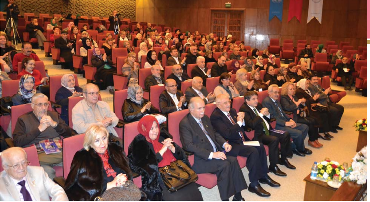
Konsere katılanlardan bir görüntü.

özelliklerin yanında dinleyip derinliklerine dalanları Yaradan'a yaklaştıran ve yaratıklarla kucaklaştıran kıymetli bir müzik türüdür. Dervişlerin dergâhlarında ve sanatçıların sahnelerde söyleyip zikir, fikir ve şükür yüklü güfteleri, gönülleri titreten nağmelerle icrâ ettikleri bu ilahîler, dinî duyguları doruk noktaya erdirmekte ve ruhları ihtiyaç duydukları manevî gıdalarla beslemektedir. Öyle ki onları dikkatle dinleyen insan, çevresindeki canlı-cansız tüm varlıkların Rabbini zikrettiğini hissederek Hakk'a yönelip, zikir ve şükür hâlinde dâim olmayı diler.