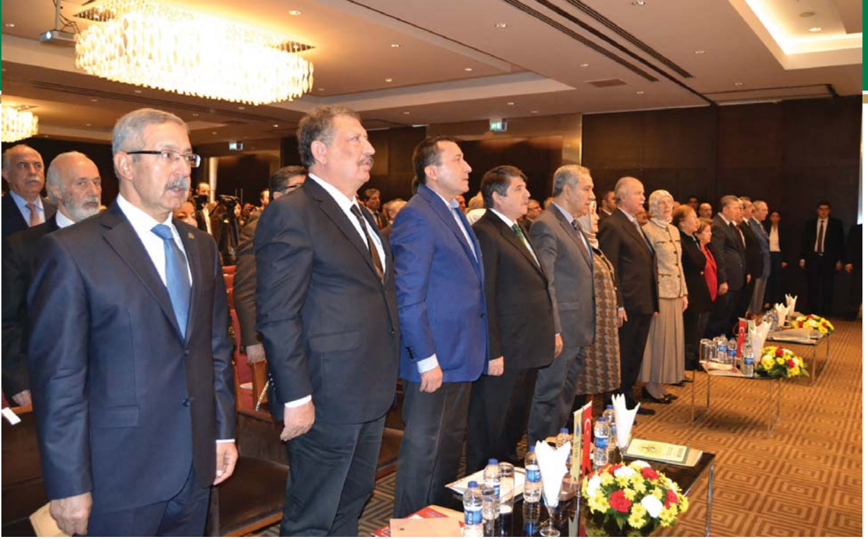
Tören, Saygı Duruşu ve İstiklâl Marşı ile başladı.

Sevinç ve saadetimizi paylaşarak gayretimizi kamçılayan Sayın Cumhurbaşkanımıza ve Sayın Başbakanımızın muhterem eşlerine teşekkür ediyor, sağlık ve saadette daim olmalarını diliyoruz.