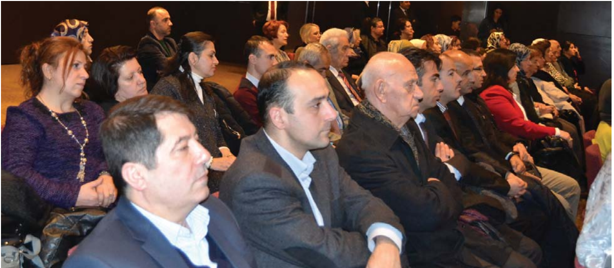
Törene katılanlardan diğer bir grup.

"Avrupa Birliği standartlarına göre Türkiye'de her 3 çocuktan 2'si şiddetli maddi yoksunluk içerisinde yaşamaktadır. Türkiye çocuklar arasında şiddetli maddî yoksunluk açısından hem Güney Avrupa ülkelerinin hem de daha düşük gelişmişlik düzeyine sahip Macaristan, Romanya gibi ülkelerin oldukça gerisinden