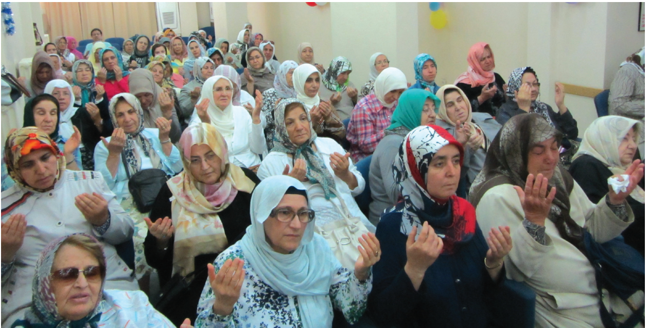
Hatim duasına katılanlardan bir grup.