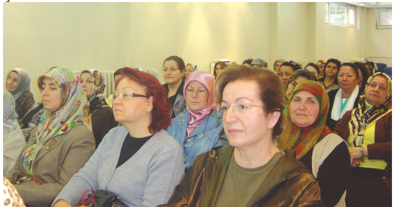
Toplantıya katılanlardan bir grup.

Bu inanç ve anlayışla camilerimize sahip çıkmalı ve cemaatsiz cami bırakmamalıyız. Camisi çok cemaati yok bir toplum değil, camileri cemaatleriyle dolan ve en büyük huzuru camilerde bulan bilinçli ve basîretli bir toplum olmalıyız."